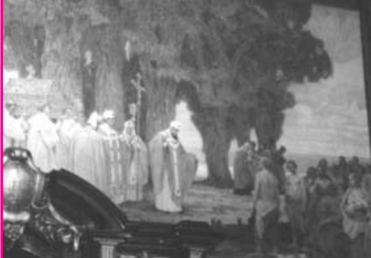
Zwischen Bischof (Mitte) und Volk (rechts) bleibt eine Lücke. Der Bischof segnet ins Leere. Der Vertreter der Hansestadt wurde aus dem Gemälde entfernt. Jetzt müsste man ihn wohl wieder hineinmalen!

Recht hatte Schill jedoch, wenn er darauf hinweist, dass die Hansestadt über Jahrhunderte ohne einen solchen Vertrag ausgekommen ist. Über den vermutlichen wahren Hintergrund des