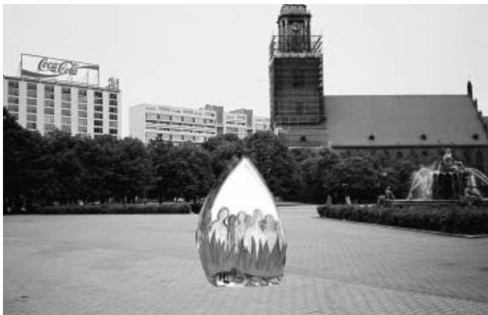
Ein weiterer Vorschlag: Ein Mahnmal für die Opfer der Kirchen vor der Marienkirche am Berliner Alexanderplatz

Doch auch die lutherische Kirche versteckt wohlweislich die Schat-