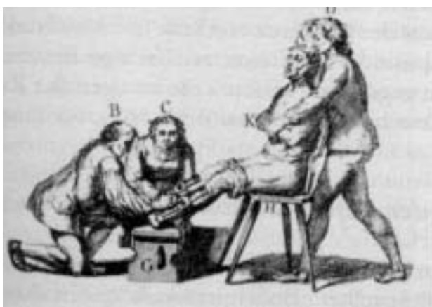
Früher folterte man Andersgläubige auf diese Weise- heute foltert man sie durch Verleumdung und Ausgrenzung

In einem eigenen Kapitel geht Holzbauer der Frage nach, wie es möglich war, dass nach dem letzten Weltkrieg in Deutschland trotz einer hervorragenden Verfassung,