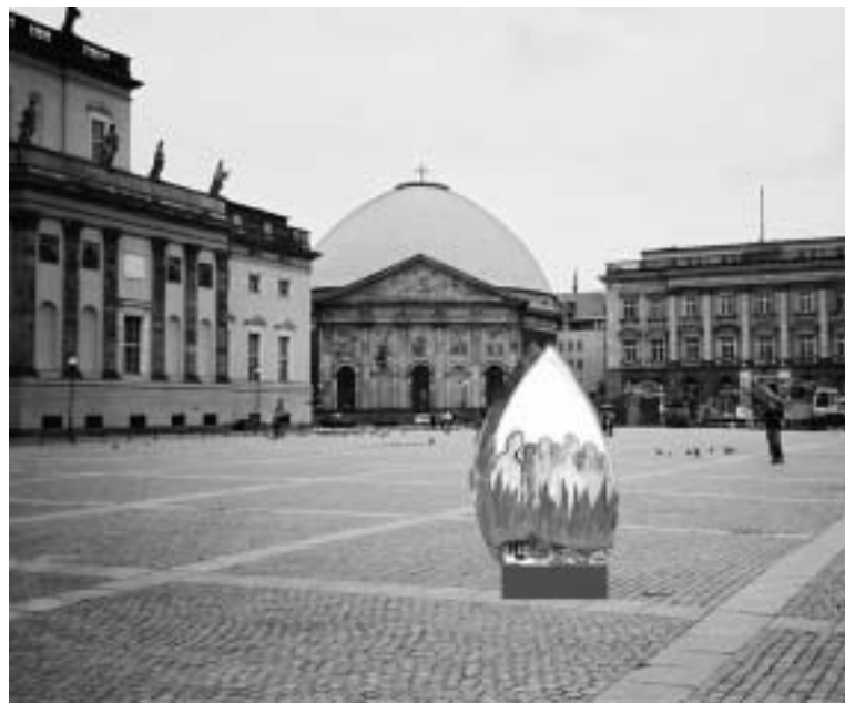
Auch hier wäre ein Mahnmal richtig: vor der katholischen Hedwigskathedrale in Berlin

Machen wir einen Sprung ins Dritte Reich. Einig waren sich die Kirchen auch in der Kollaboration mit Hitler. Dabei waren die protestantischen Pfarrer zunächst noch ein ganzes Stück enthusiastischer Hitler als dem "großen Befreier des deutschen Volkes" gegenüber. Nachdem der Vatikan das ersehnte Konkordat von Hitler bekam, löste er als Gegenleistung nicht nur die katholische Zentrumsparterie auf (ein Vorläufer der CDU), sondern wies auch die Bischöfe an, mit Hitler zu kooperieren.