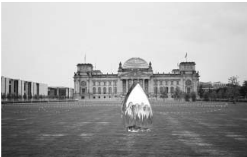
Ein Mahnmal für die Millionen Opfer der Kirche vor dem Berliner Reichstag - so könnte es aussehen!

sie uns vorgeben? Warum wird ein Krieg wie im Irak verdammt, ein anderer wie im Kosovo gesegnet? Wir wollen niemanden in seinem Glauben verletzen oder angreifen. Aber wir decken auf, was die Institutionen Katholisch und Evangelisch zu verantworten haben." Mit der Frage "Brauchen wir ein Mahnmal für die Opfer der Kirche, auch hier in Berlin?", eröffnete Ralf Speis das Podium.