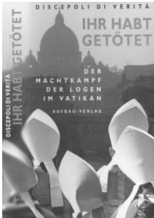
"Ihr habt getötet - der Machtkampf der Logen im Vatikan" Aufbau Verlag € 16,90

Zeitgeschichte, dass die Autoren anonyme Kirchen-Insider sind, die sich hinter dem Pseudonym Discepoli di veritá (Jünger der Wahr-