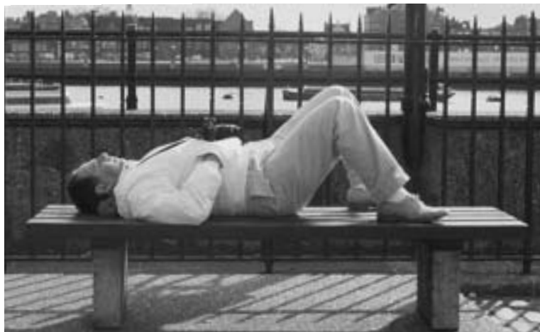
Beim Thema Kirchensubventionen befindet sich unser Staat in einer Dauersiesta. Aufwachen!

fordert, die anderen Subventionen zu streichen: Militärseelsorge, Ausbildung der Theologen, staatlicher Religionsunterricht, staatliche (und städtische) Gehälter von Bischöfen usw. usf.