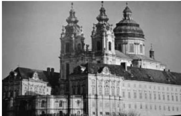
Österreich ist nicht nur klösterreich (hier Stift Melk) - es füttert die steinreichen Kirchen auch noch ständig mit staatlichen Subventionen.

Kirche von den staatlichen Meldeämtern; O dass die Kirchen - wie in