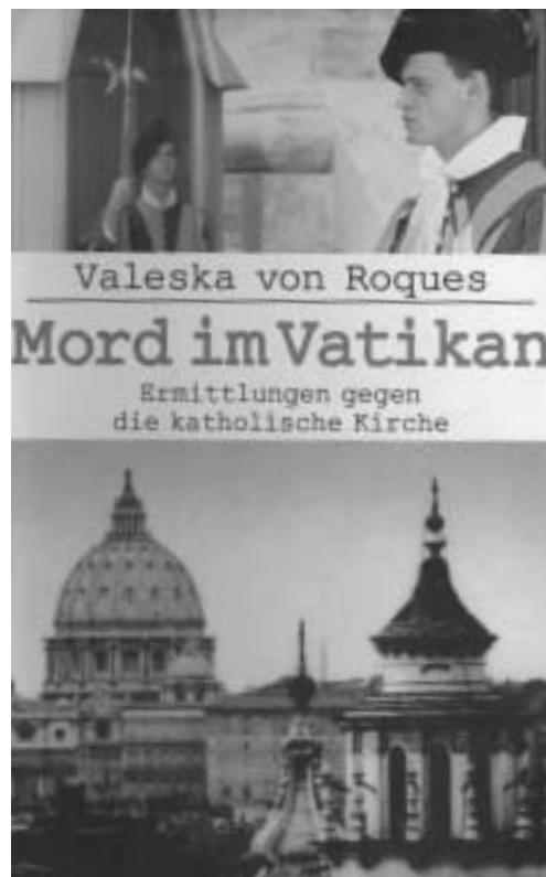
"Mord im Vatikan - Ermittlungen gegen die katholische Kirche" Hoffmann und Campe, € 16,90